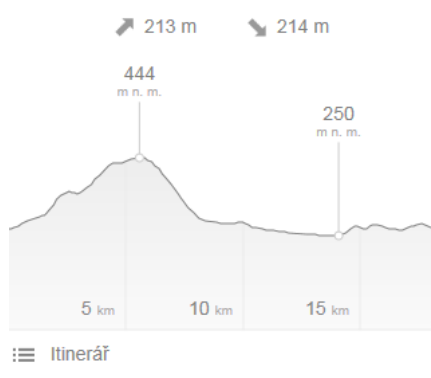
Dojezd do cíle od Suchdolu